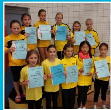
Siegerehrung D-Jugend weiblich