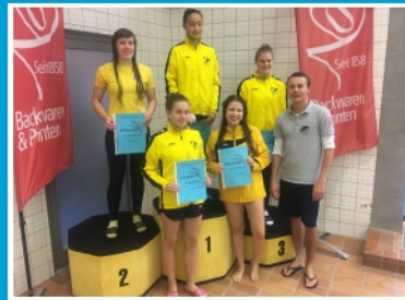
Siegerehrung Ofene Klasse