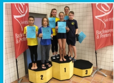
Siegerehrung C-Jugend männl./weibl.